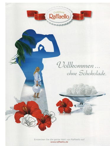
Am meisten bewirkt