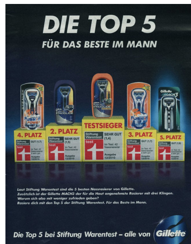
Am meisten erinnert