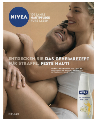
Am besten erkannt